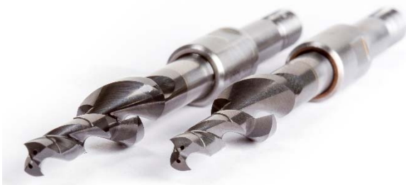
Bild 6: Um Materialkombinationen aus verschiedenen Aluminiumlegierungen prozesssicher zu bearbeiten ist der Alu-Alu-Bohrer von MAPAL unter anderem mit einer integrierten Reibstufe ausgestattet.

Bild 5: Für eine zusätzliche Stabilisierung kommen sogenannte „Nosepieces“ zum Einsatz. Diese erschweren den Abtransport der Späne.