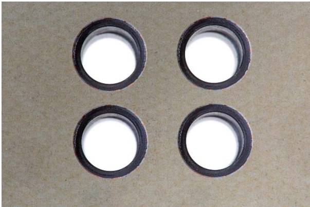
Bild 3: Im Flugzeugbau wird häufig ein spezielles CFK mit „Copper Mesh“ verwendet. Jegliche Delaminationen oder Faserüberstände am Bohrungseintritt werden mit dem Werkzeug von MAPAL vermieden.