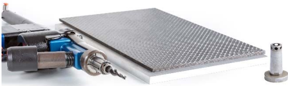
Bild 5: Für eine zusätzliche Stabilisierung kommen sogenannte „Nosepieces“ zum Einsatz. Diese erschweren den Abtransport der Späne.

Telefon: +49 7361 585-3683 Telefax: +49 7361 585-1019 E-Mail: presse@mapal.com