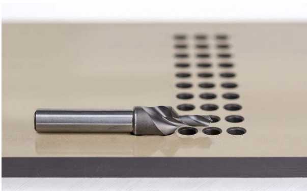
Bild 2: Das Bohr-Senk-Werkzeug zur Trockenbearbeitung von CFK-Alu-Schichtverbundwerkstoffen vereint die Eigenschaften eines Bohrers zur Bearbeitung von Aluminium mit denen eines Bohrers zur CFK-Bearbeitung.

MAPAL Präzisionswerkzeuge Dr. Kress KG Postfach 1520 | D-73405 Aalen