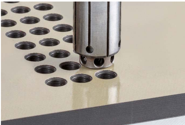
Bild 1: Bei Bearbeitungen mit Bohrvorschubeinheiten müssen die eingesetzten Werkzeuge mit zusätzlichen Stabilisierungsmerkmalen ausgestattet sein.